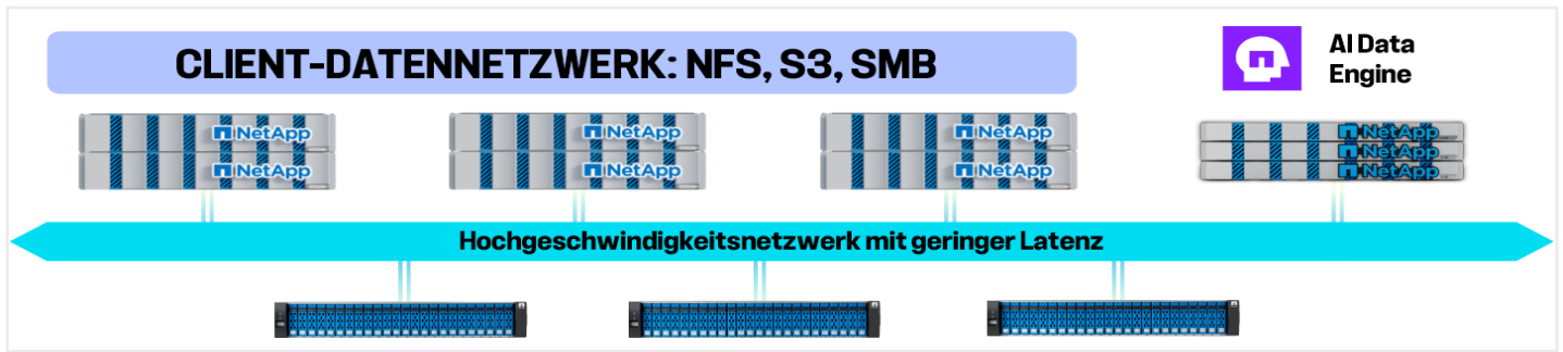
Abb. 1: Die NetApp AFX-Bereitstellung besteht aus AFX 1K-Speichercontrollern, NX224 NVMe-Speichergehäusen und optionalen DX50-Datenrechenknoten.