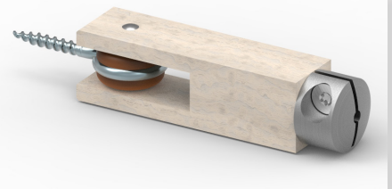
Ventilaufhängung einer Pfeifenorgel (KeyShot Rendering)

Branche: Musikinstrumentenbau, Orgelbau, Konstruktions- und Visualisierungsdienstleistungen Produkte: Mechanische, pneumatische und mechatronische Kom- ponenten und Bauteile für Pfeifenorgeln; Vorrichtungen und Apparate für den Orgelbau Mitarbeiter: 15, davon 2 Konstrukteure