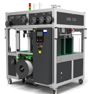
Rendering im Kundenauftrag: Umreifungsmaschine