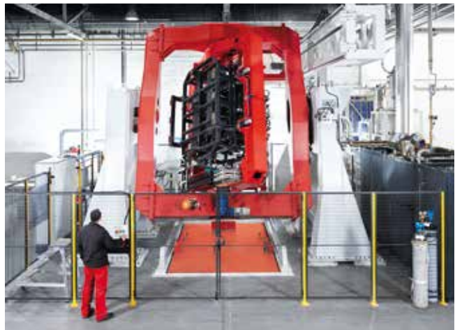
Im Rotationsverfahren lassen sich extrem gute Oberflächen erzielen, die Entformung ist allerdings stark von guter Konstruktionsarbeit abhängig

„Wir arbeiten derzeit mit dem Systemhaus Inneo intensiv an den letzten Anpassungen“, erläutert Franke, „beispielsweise an der automatischen Umwandlung der freigegebenen Zeichnungen ins PDF-Format.“ Für den Massenimport bestehender Produkte nutzt man bei OPG das Inneo-Produkt Model Processor.