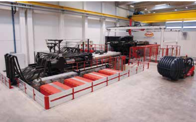
Die eigenen Angaben zufolge größte Spritzgießmaschine der Welt mit 55 000 kN Schließkraft steht bei Otto Graf und produziert Tankhälften