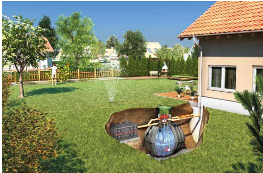
Regenwassersammelsysteme gehen heute weit über die gute alte Regentonnen hinaus, wie dieses unterirdische System von Otto Graf zeigt

„Unsere Produkte sehen oft einfach aus, haben es aber in sich“, beschreibt Produktentwickler Stefan Franke die Herausforderungen in der Konstruktion. „Während im Maschinenbau eine Baugruppe