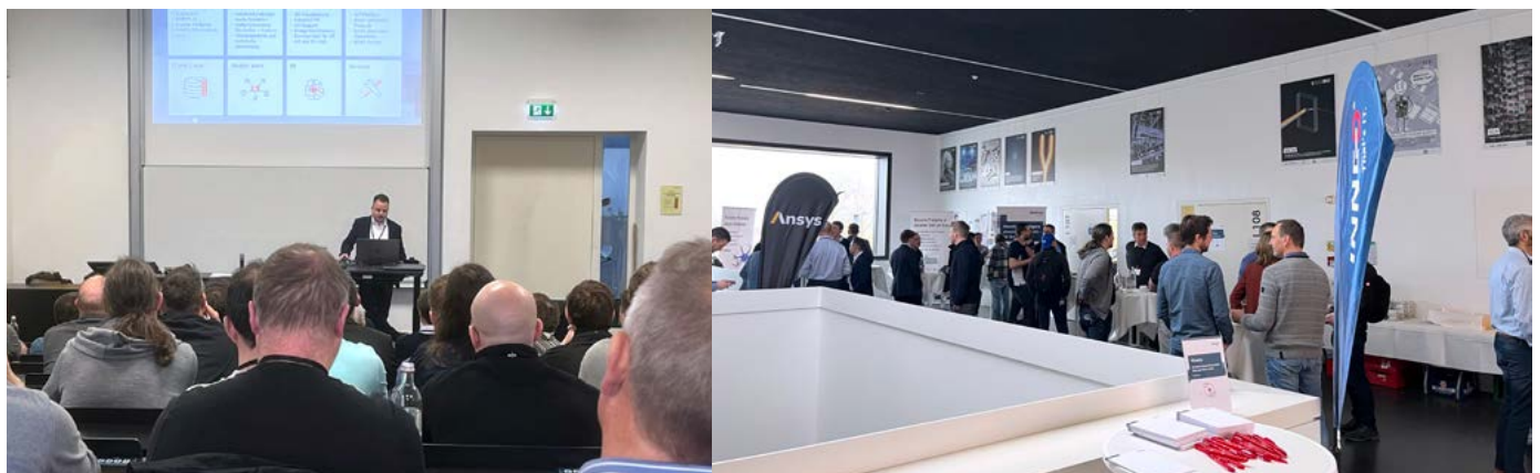
Impressionen aus früheren Veranstaltungen