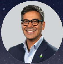
SPECIAL GUEST Neil Barua CEO, PTC

Mit Entscheidern und Experten aus den Bereichen CAD/PLM · IT und Cloud · Simulation · IIoT · Digitale Realität · ALM